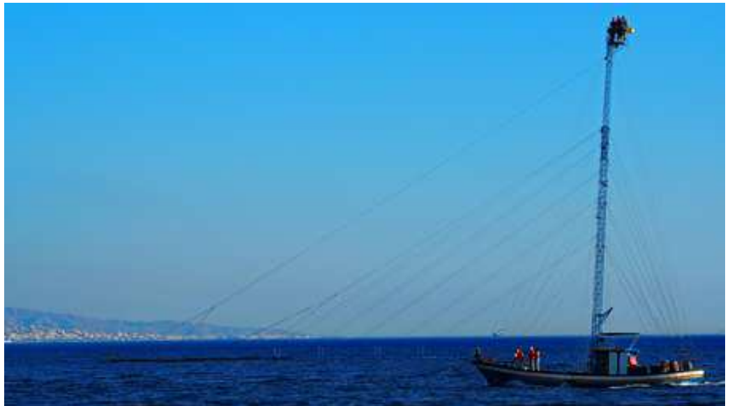
Schwertfischen in der Strasse von Messina

Nun waren wir also an der Ostküste von Sizilien unterwegs Richtung Süden. Wir ankerten in Taormina und am nächsten Abend liefen wir in Syrakus ein. Dieser Ort bietet für uns Segler eine grosse, gut geschützte Ankerbucht mit einem wundervollen Panorama. Zudem gibt es in Syrakus viel Kunst und Kultur zu besichtigen. Wir liessen es uns nicht nehmen, das berühmte Ohr des Dyonisos, die weiteren Ausgrabungsstätten sowie das archaische Museum zu besuchen.