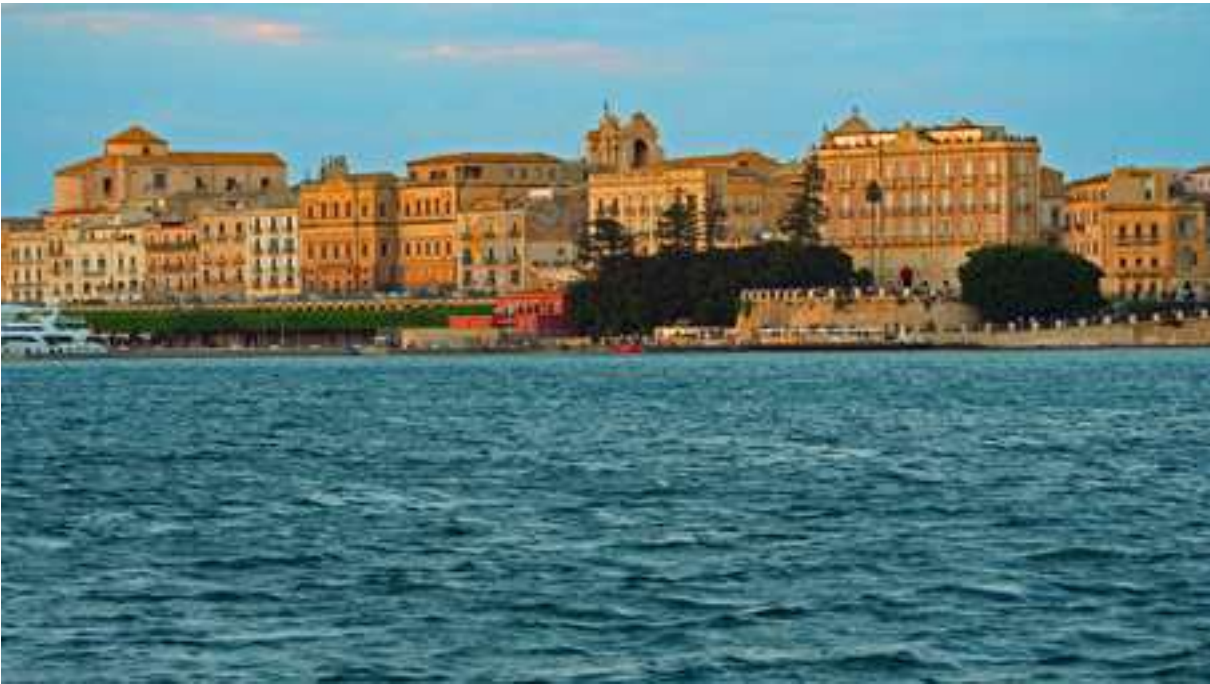
Der Ankerplatz von Syrakus