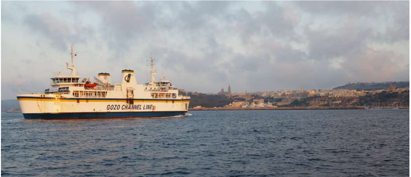
Zwischen Malae und Gozo verkehren non stop Fähren

Dann kam der grössere Trip von Gozo nach Lampedusa. Würden wir es schaffen gegen den Wind, hatte es überhaupt genügend Wind um zu segeln? Es hatte. Wir legten beim Morgengrauen ab und auf offener See hatten wir schon bald mehr Wind als uns lieb war. Es ging grad mit vollem Tuch ohne zu reffen, das Schiff wurde ordentlich nass. Aber der Gymnos-Kat bewährte sich wie immer sehr, auch hart am Wind segelt das Schiff erstaunlich gut und schnell. Beim Eindunkeln liefen wir in Lampedusa ein. Wir hatten mit einem Nachttörn gerechnet, aber der gute Wind hatte uns mit einem super Tempo nach Lampedusa getragen.