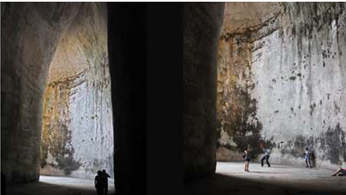
Das Ohr des Dyonisos

Jetzt galt es eine Entscheidung zu treffen. Entweder wir fuhren nun wie eigentlich geplant nach Licata Marina, um dort für ein Jahr Station zu machen, oder wir zogen weiter bis Tunesien. Die Marina Monastir und die tunesische Küste hatte uns immer schon gereizt und irgendwie hatten wir wieder mal Lust auf Nordafrika. Licata konnten wir auch nächstes Jahr noch anlaufen. Nach einer Nacht drüber Schlafen war es entschieden, die Reise ging weiter Richtung Malta. Ab sofort mussten wir um Höhe kämpfen, dies bedeutete Segeln hart am Wind gegen den vorherrschenden Nord-West-Wind und dies sollte so bleiben bis Tunesien. Wir waren gespannt, wie unser Katamaran das meistern würde. Die Überfahrt nach Malta verlief problemlos. Gegen Abend ankerten wir in einer Bucht bei Comino.