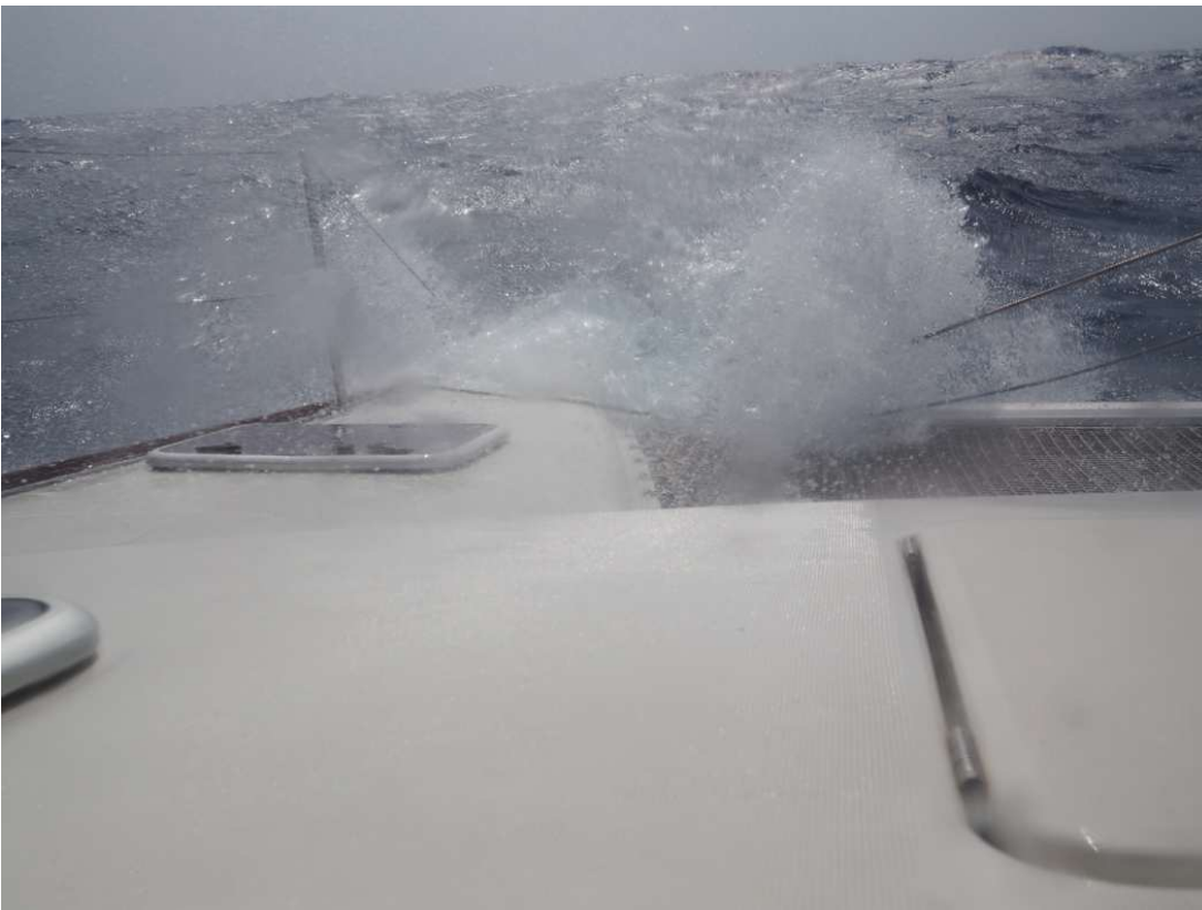
Unterwegs hart am Wind, ein Kat macht auch bei Anlufkursen nicht viel Schräglage.

Dann kam der grössere Trip von Gozo nach Lampedusa. Würden wir es schaffen gegen den Wind, hatte es überhaupt genügend Wind um zu segeln? Es hatte. Wir legten beim Morgengrauen ab und auf offener See hatten wir schon bald mehr Wind als uns lieb war. Es ging grad mit vollem Tuch ohne zu reffen, das Schiff wurde ordentlich nass. Aber der Gymnos-Kat bewährte sich wie immer sehr, auch hart am Wind segelt das Schiff erstaunlich gut und schnell. Beim Eindunkeln liefen wir in Lampedusa ein. Wir hatten mit einem Nachttörn gerechnet, aber der gute Wind hatte uns mit einem super Tempo nach Lampedusa getragen.